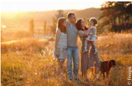
Santé et bien-être au coeur des Semaines de la parentalité.