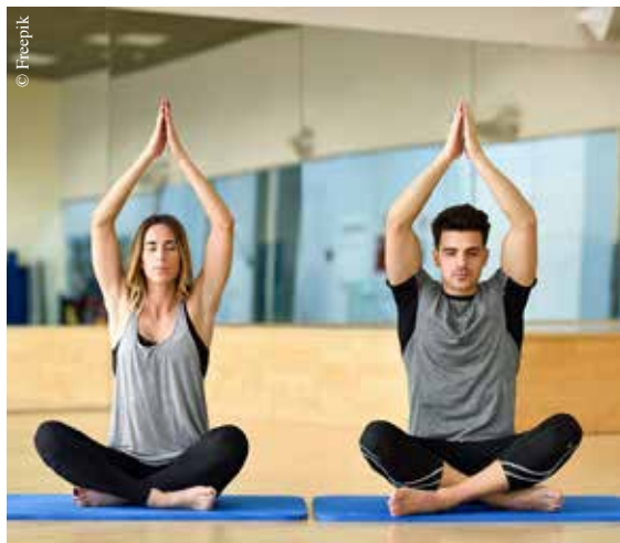
Atelier yoga pour les parents.

Contact : mairie, 36, rue de la Chapelle – La Ferrière, au 02 51 40 61 69, à mairie@laferriere-vendee.fr et sur www.laferriere-vendee.fr