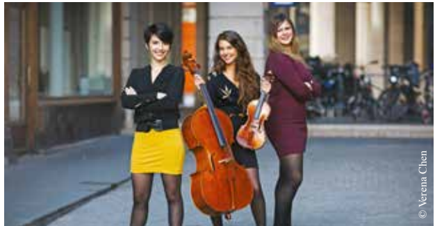
Le Trio Sõra.

Faisant preuve d'une réelle osmose sur scène, les trois musiciennes se distinguent également par une rare sensibilité musicale, influencée par la diversité des héritages